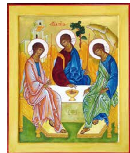
De Heilige Drie-eenheid van schilder Andrej Roeblov